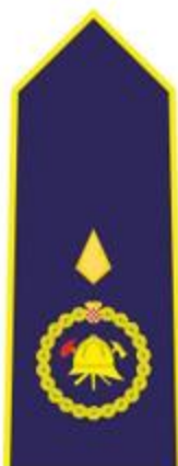
VIŠI VATROGASNI ČASNIK