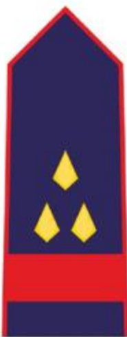
STARLIJI VATROGASNI DOČASNIK