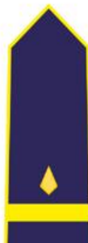
STARLIJI VATROGASNI ČASNIK