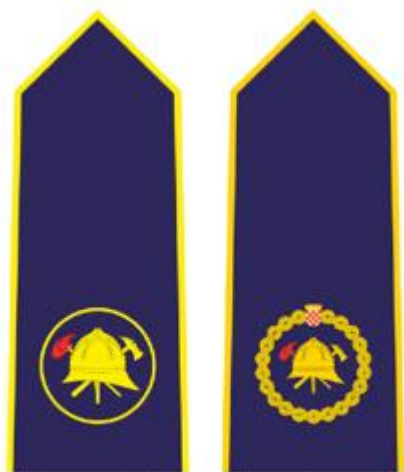
POČASNI VATROGASNI ČASNIK