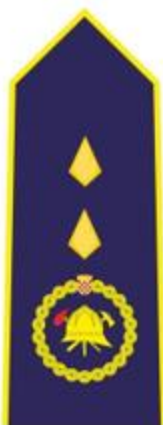
VIŠI VATROGASNI ČASNIK I. REDA