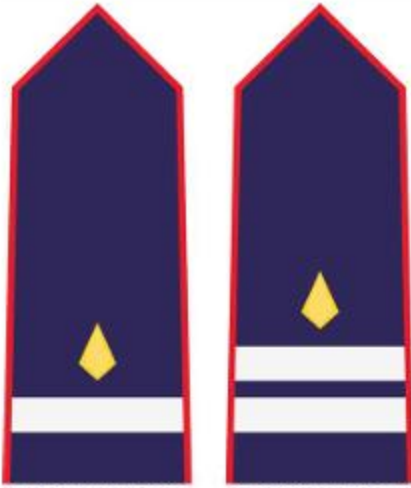
PRIPADNIK VATROGASNE MLADEŽI