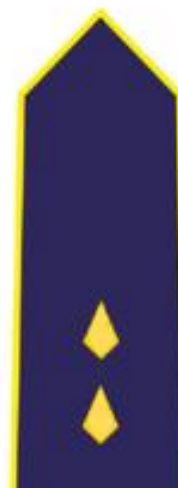
VATROGASNI ČASNIK I. REDA