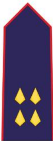
VATROGASNI DOČASNIK I. REDA